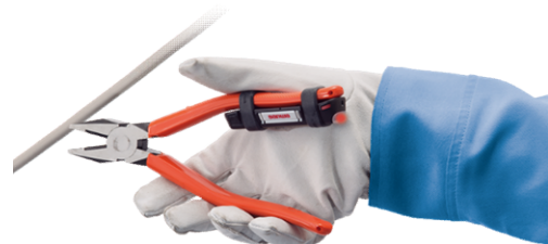
活線センサ使用状況