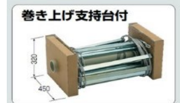
巻き上げ支持台付