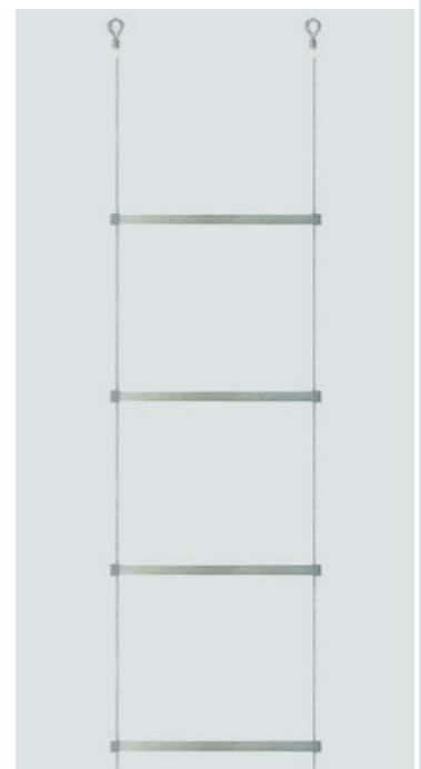
長さ：14.5m (4.5m×3フロア、又は、3.4m×4フロア分)