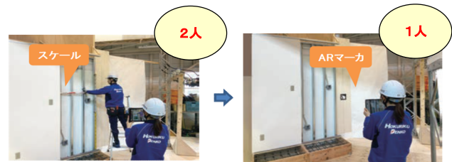
図4 ARメジャー機能による省力化・省人化